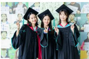
祝诸位 zjcm 毕业快乐! 来日之路, 光明灿烂。

让我们把这份情感, 化作一首诗, 轻轻吟唱, 让那别离的涟漪在心中荡漾, 成为心中最美的风景。