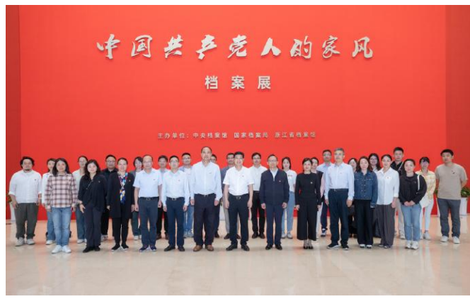
学院开展党纪学习教育主题活动，参观“中国共产党人的家风”档案展。

原原本本学习新修订的《中国共产党纪律处分条例》，以正面引领和反面警示相结合的方式，进一步筑牢拒腐防变思想防线，不断增强廉洁自律意识，凝聚清廉价值共识，营造风清气正的政治生态和良好育人环境。