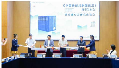
《中国传统戏剧图像志》新书发布会暨戏曲史志研究座谈会现场。